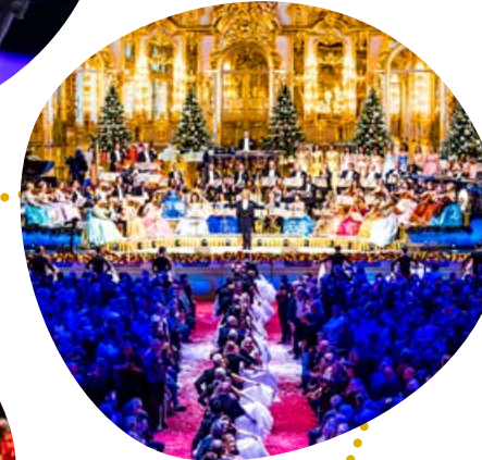
Fotografie André Rieu