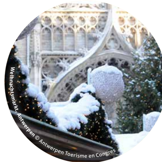
Weihnachtsmarkt, Antwerpen