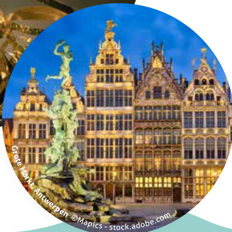
Grande Markt Antwerpen