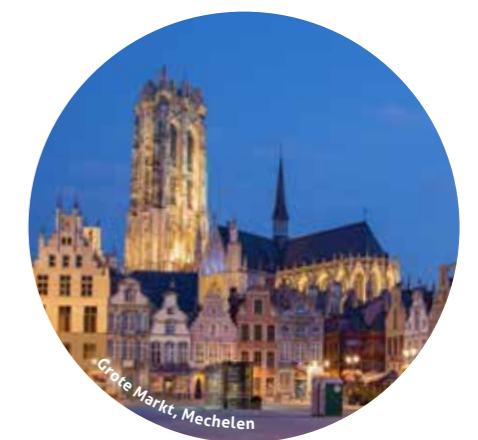
Grote Markt, Mechelen