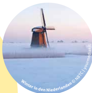
Winter in den Niederlanden