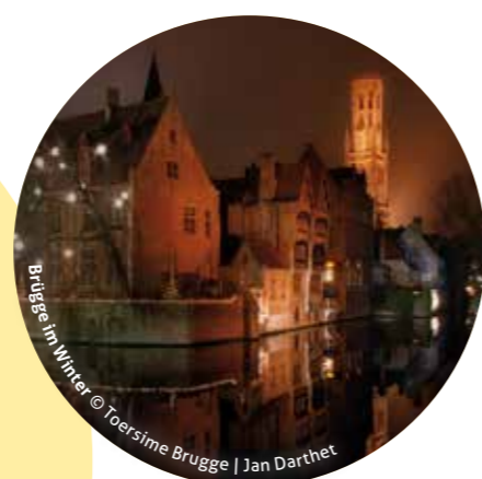
Brügge im Winter

Vom RIESENRAD an der St.-Bavo-Kathedrale hat man einen herrlichen Ausblick über das winterliche GENT . Die Stadt lädt auch im Winter Alt und Jung zum FLANIEREN ein!